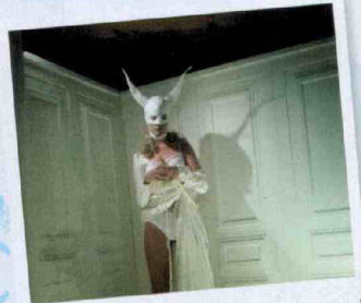
'De Marlies Dekkers-show: The Muse.'